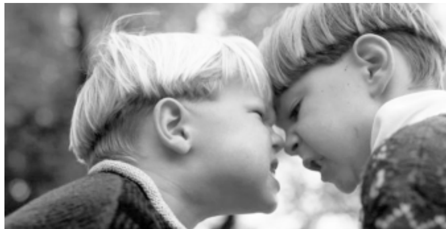
Иногда надо проявить характер