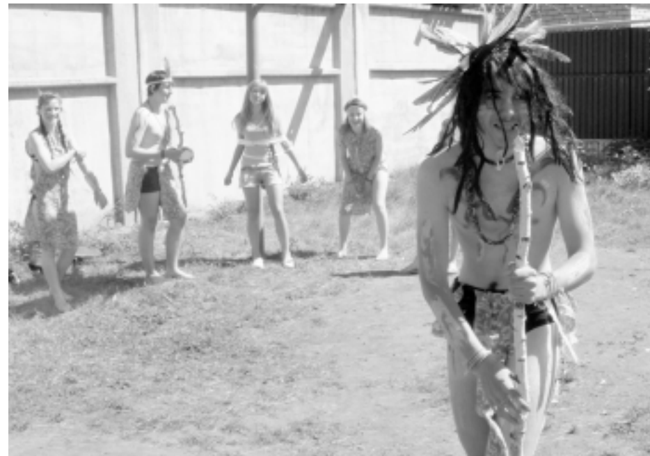
Неумолимые и суровые индейцы