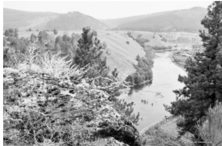
И речка горня бежит...

Но весна постепенно сменяется летом. Это пора, когда наш пруд заполняется не только спасающимися от жары людьми, но и перелётными птицами. Лебеди, утки, цапли... В